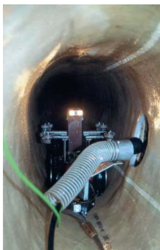
Vor dem Seiteneinstieg: Die LRB in einem Siel „Klasse V Altona“, das per Inliner saniert wurde.

Nur vor einem musste das patente System lange Zeit kapitulieren. Das war der Start aus groß dimensionierten Eiprofilkanälen heraus, wie sie beispielsweise